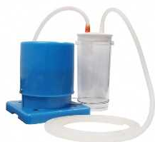
足踏式吸引器「アモレFS1」