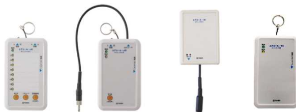
ワイヤレスコール「エアコールシリーズ」