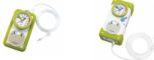
カフ圧調整器 「カフチェッカー」